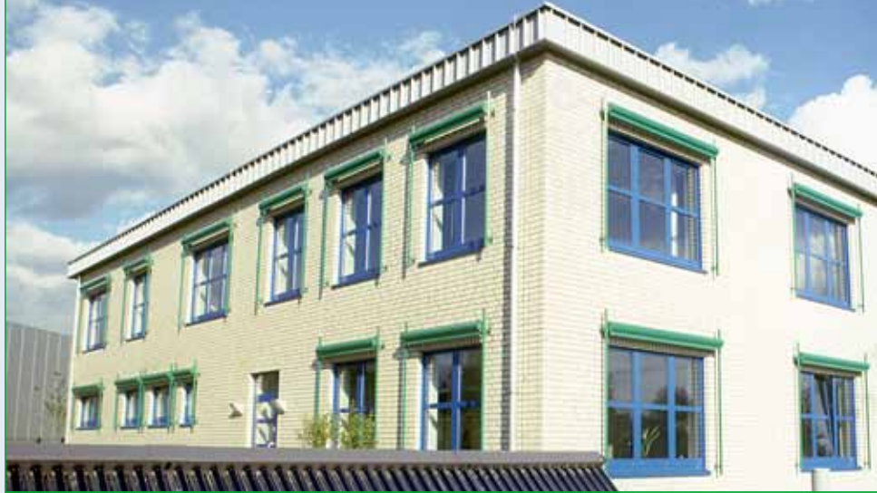
Auch die Hauptverwaltung der „Tochter“ Vereinigte Gas- und Wasserversorgung GmbH in Rheda-Wiedenbrück ist Teil des Forschungsprojekts.

Aber auch als zuverlässiger Erdgaslieferant ist man den Kunden hier bestens bekannt, denn Gelsenwasser ist seit mehr als 30 Jahren der Grundversorger im Ort. Hinzu kommt ein kontinuierliches kulturelles wie soziales Engagement. So wurden allein im Rahmen von GELSENWASSER-Schul- und Generationenprojekt bereits 16 Initiativen in Ascheberg unterstützt.