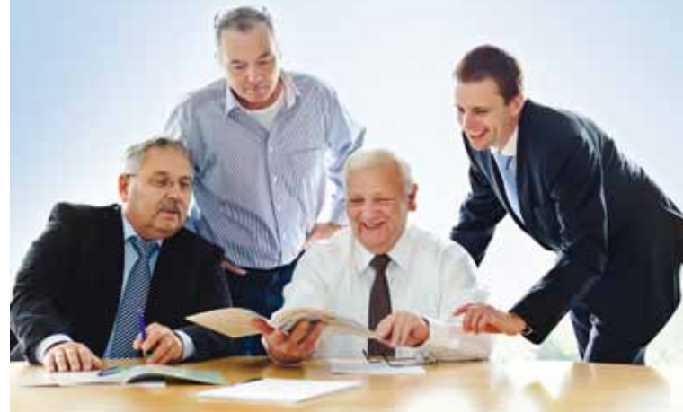
Das Gelsenwasser-Vertriebsteam – kompetente Ansprechpartner rund um Erdgas und Strom

Über das Grundversorgungsgebiet hinaus bietet die GELSENWASSER AG immer mehr Menschen in Nordrhein-Westfalen und dem angrenzenden Niedersachsen Erdgas und Ökostrom aus Wasserkraft an. Zum Jahresbeginn wurde der Radius noch einmal nennenswert erweitert: Er reicht nun vom südlichen Emsland im Norden über Osnabrück und Georgsmarienhütte bis Warstein und Hagen im Süden. Interessenten erhalten im Internet unter Verwendung der Postleitzahl Auskunft über Produkte, Preise und die fairen Vertragsbedingungen: www.gelsenwasser.de/Privatkunden .