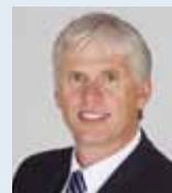
Stellungnahme von Paul Berlage, Bürgermeister von Drensteinfurt

Auch der Rat der Stadt sieht die Risiken und wird Probebohrungen oder einer Förderung nicht zustimmen, solange eine Gefährdung des Trink- und Grundwassers nicht auszuschließen ist. Um dies bewerten zu können, müssen Gutachten von unabhängigen Wissenschaftlern vorgelegt werden. Zum gegenwärtigen Zeitpunkt gibt es keine Zustimmung zum Fracking. Das heißt auch, dass es keine schnellen Entscheidungen geben kann. Gleichzeitig ist dringend erforderlich, das Bergrecht den neuen technischen Möglichkeiten anzupassen und nicht nur eine Umweltverträglichkeitsprüfung verpflichtend vorzuschreiben, sondern auch eine Beteiligung der Öffentlichkeit und der Naturschutzverbände.